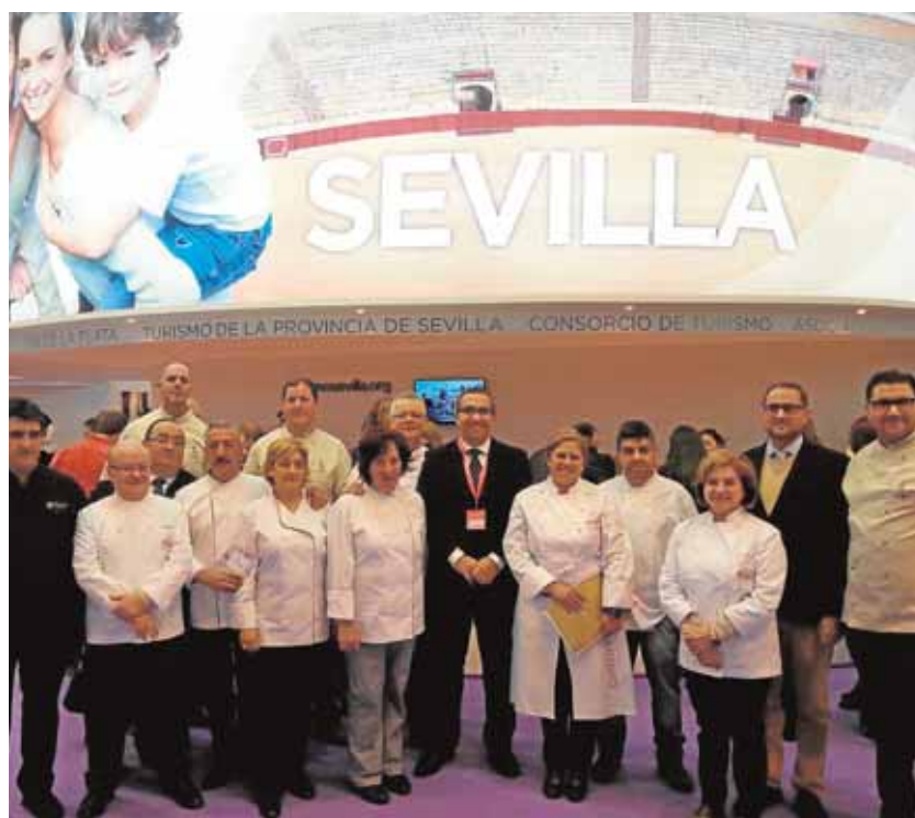
Restauradores palaciegos en un acto de la Ruta del Arroz en Fitur