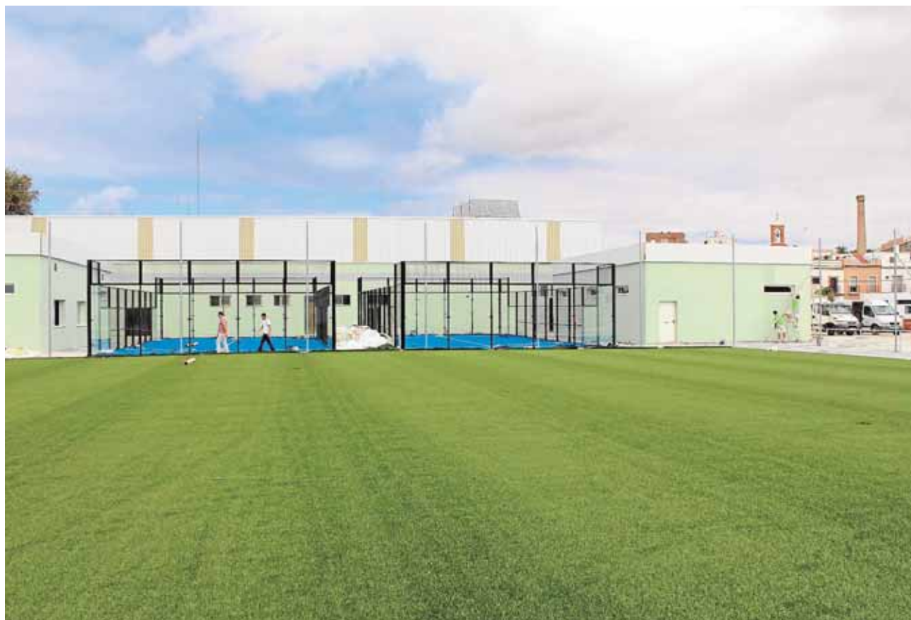
Parte de las nuevas instalaciones deportivas de los Salesianos