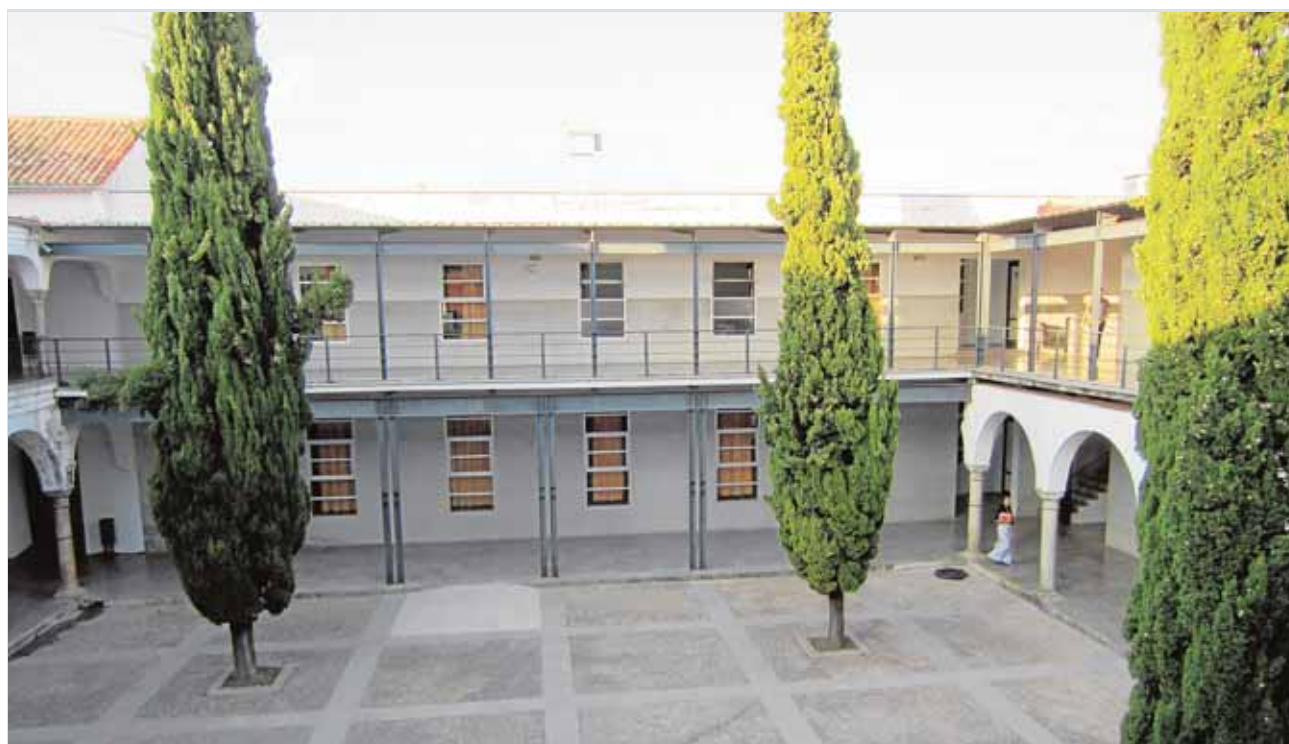
El claustro del IES El Carmen, que sufre continuas humedades cuando llega el invierno