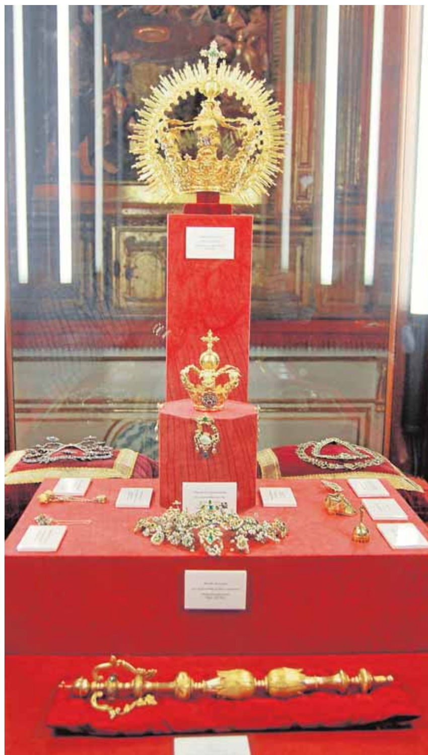
El ajuar de la Virgen solo puede verse en contadas ocasiones

En la primera de las sedes, entre el ajuar de la Virgen hay piezas que sobresalen y que han configurado la peculiar imagen de la Virgen de Gracia. Entre ellas los rostrillos, el de esmeraldas fechado en 1680 y el de salida, una