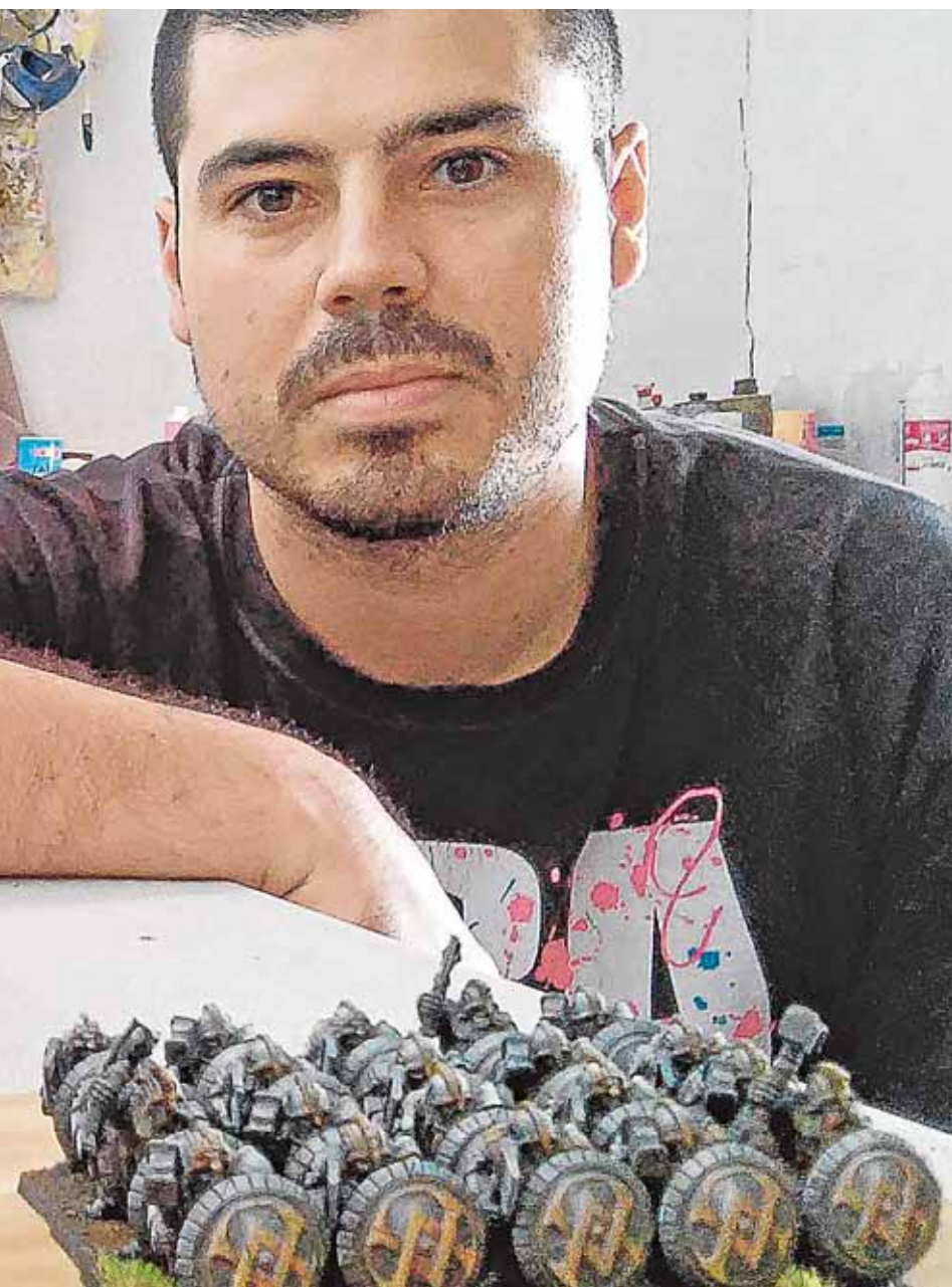
pintado en su taller de Osuna.

presa dedicada a la venta de insecticidas nicotínicos, aunque en la web de la empresa se ofrecía mezclas de picadura y tabaco sin envasar. Los agentes han intervenido 3.200 kilogramos de de hojas de tabaco y la maquinaria para su manufactura. B.M.