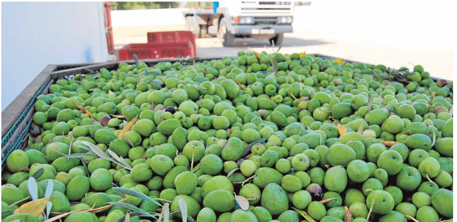
La campaña de recogida de la aceituna gordal en Utrera acaba de comenzar y se extenderá durante unos veinte días

pital de Alta Resolución de Lebrija, que atenderá a lebrijanos y vecinos de El Cuervo y Las Cabezas y que aún no ha abierto sus puertas. El nuevo ramal permitirá un acceso adecuado y seguro al centro hospitalario a usuarios y ambulancias. A.H.